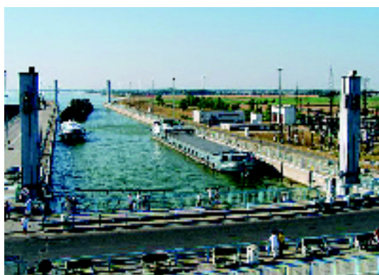
Pohľad na vodné dielo Gabčíkovo-Nagymaros

Ing. Karol Ujházy V Prahe, august 2007